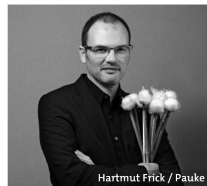
Hartmut Frick / Pauke